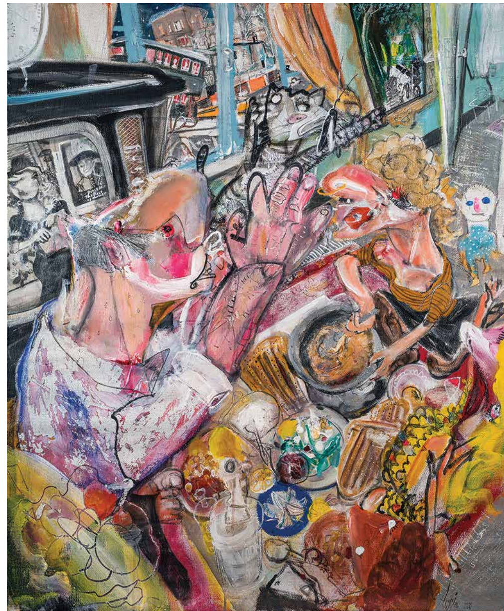
ARSIA MOGHADDAM A World Without a Few Things Acrylic on canvas 120 x 100 cm 2020