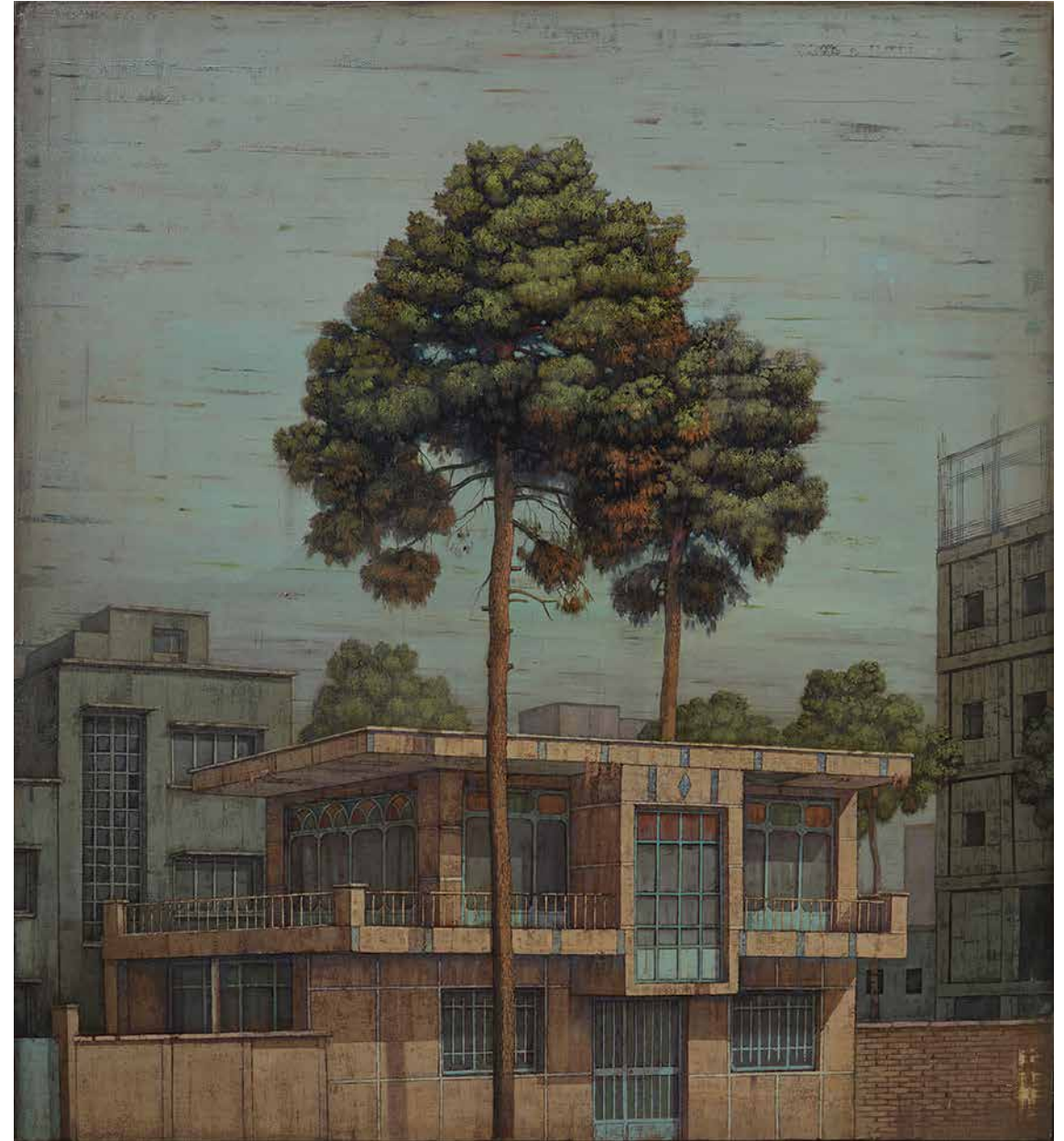
TAHER POURHEIDARI Houses and Pine Trees Oil on canvas 160 x 145 cm 2019