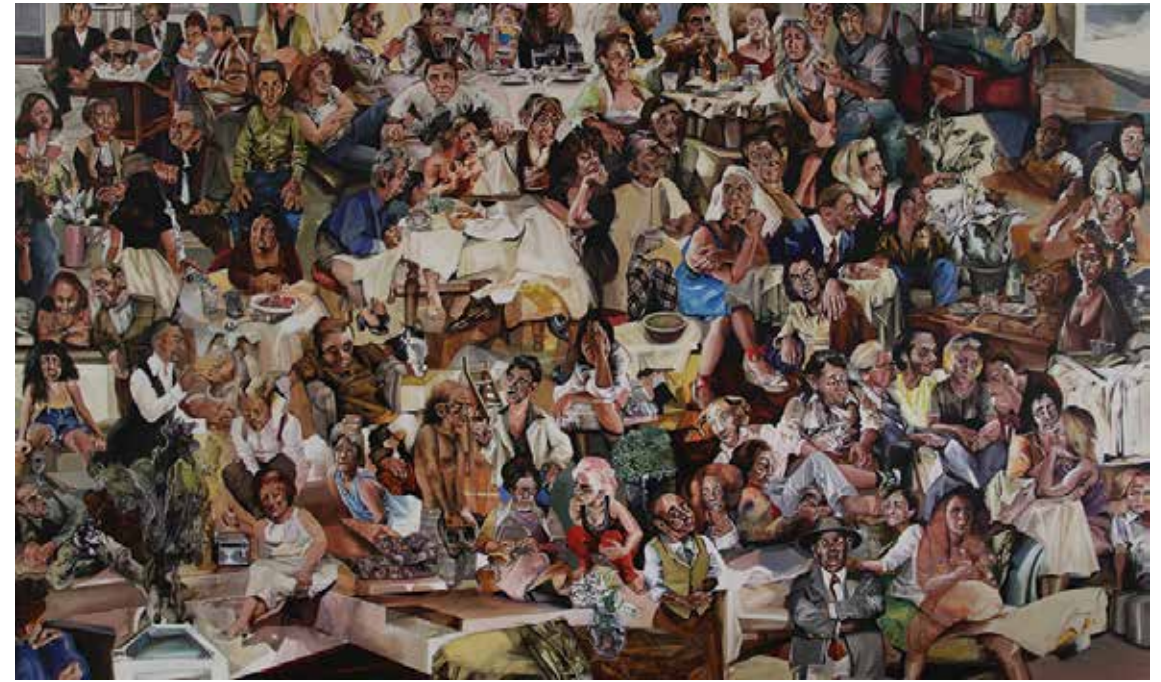
RASHIN GHORBI Untitled from the Family series Acrylic on canvas 120 x 200 cm 2020