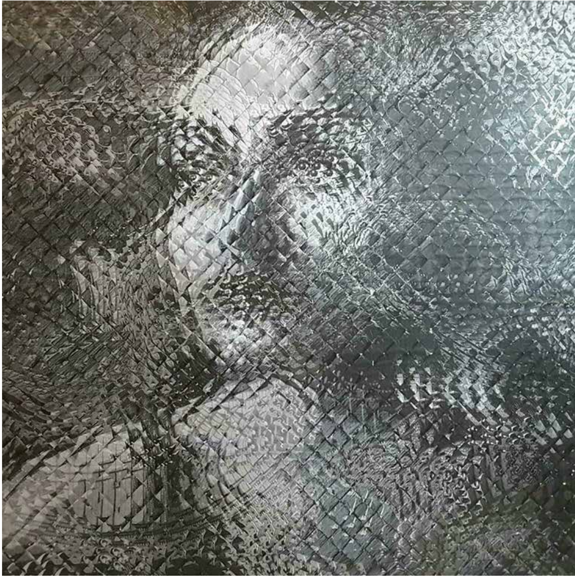
SIMA SHAHMORADI Untitled Folded paper on canvas 170 x 150 cm 2018