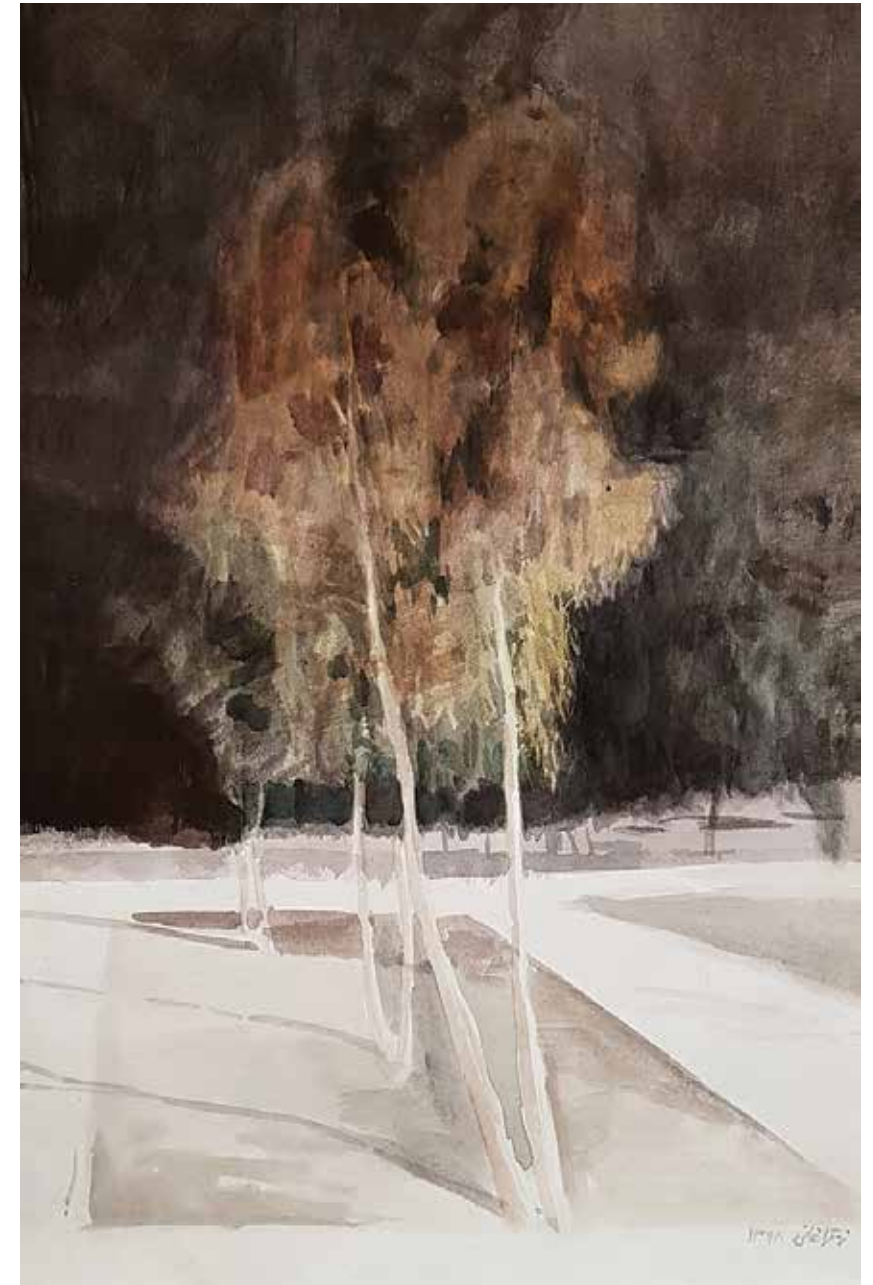
ZAHRA QARAKHANI Eucalyptus Trees Watercolor on cardboard 35.5 x 21 cm 2020