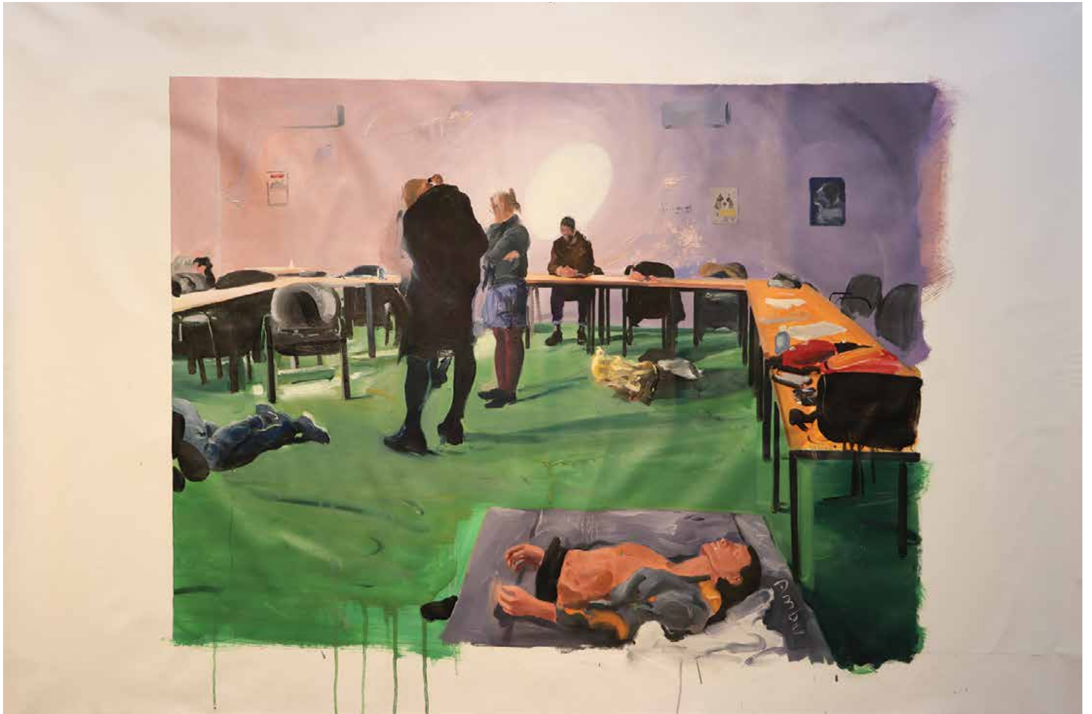
SHANTIA ZAKERAMELI Untitled Oil on canvas 105 x 148 cm 2019