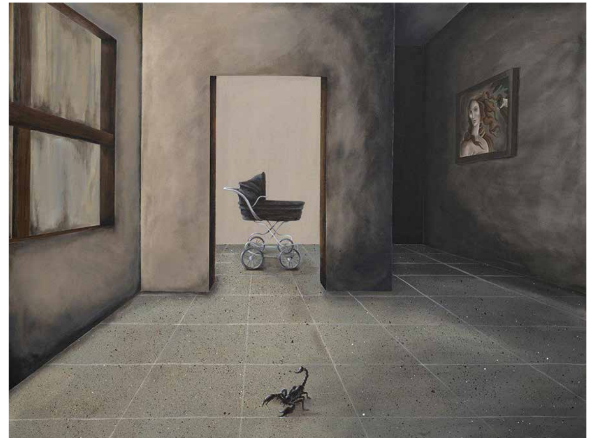
AFRA SAFA This Birth Was a Bitter Agony for Us Acrylic on canvas 100 x 130 cm 2018