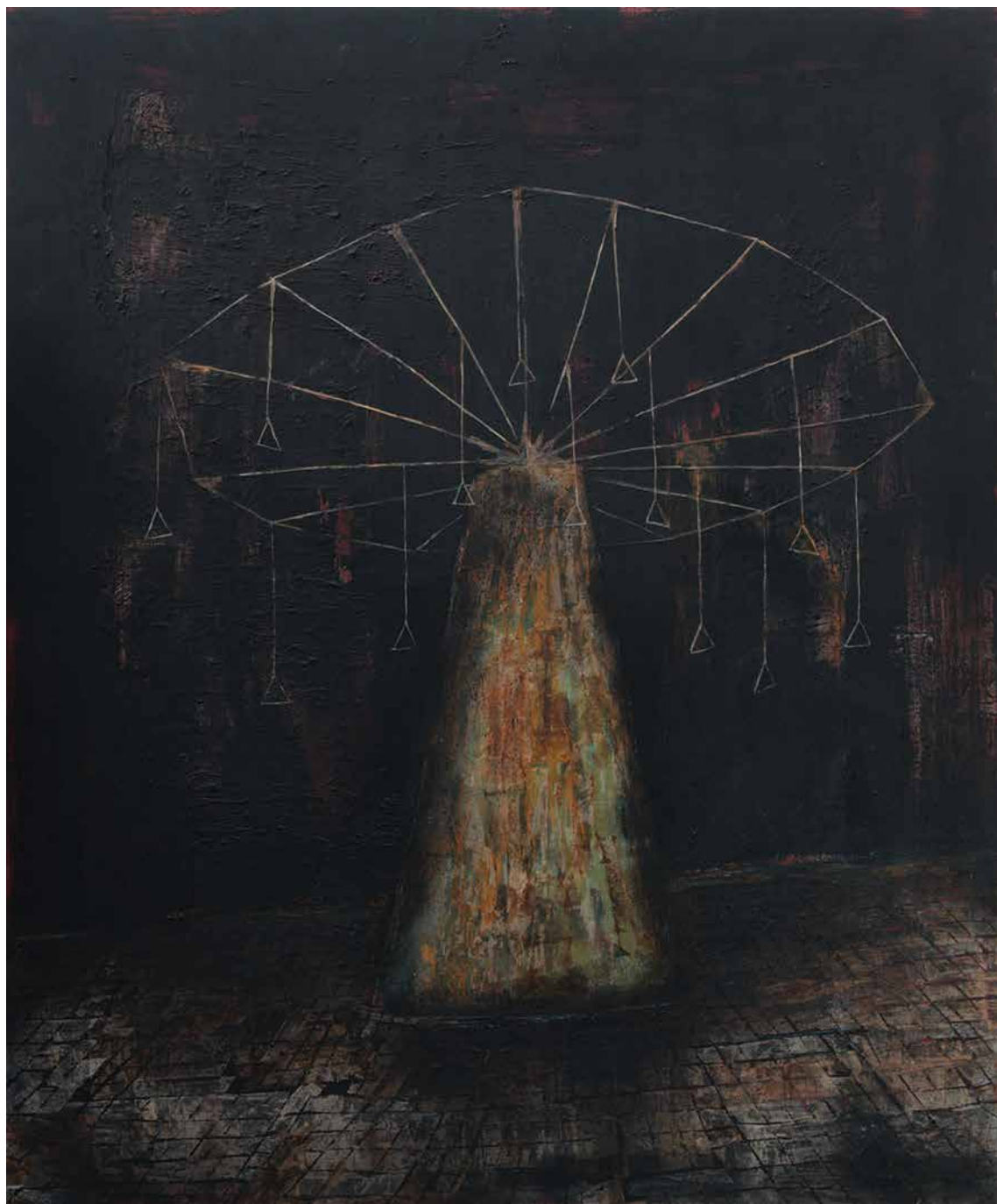
SOLMAZ HESHMATI Untitled Mixed media on canvas 120 x 100 cm 2018