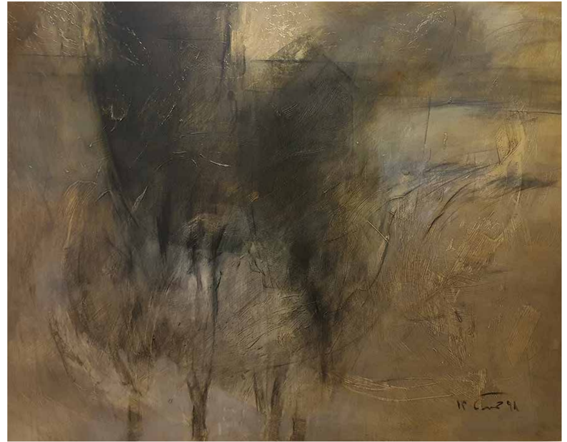
MEHDI TAVAEI-HAMIDI Untitled Oil on canvas 130 x 170 cm 2019