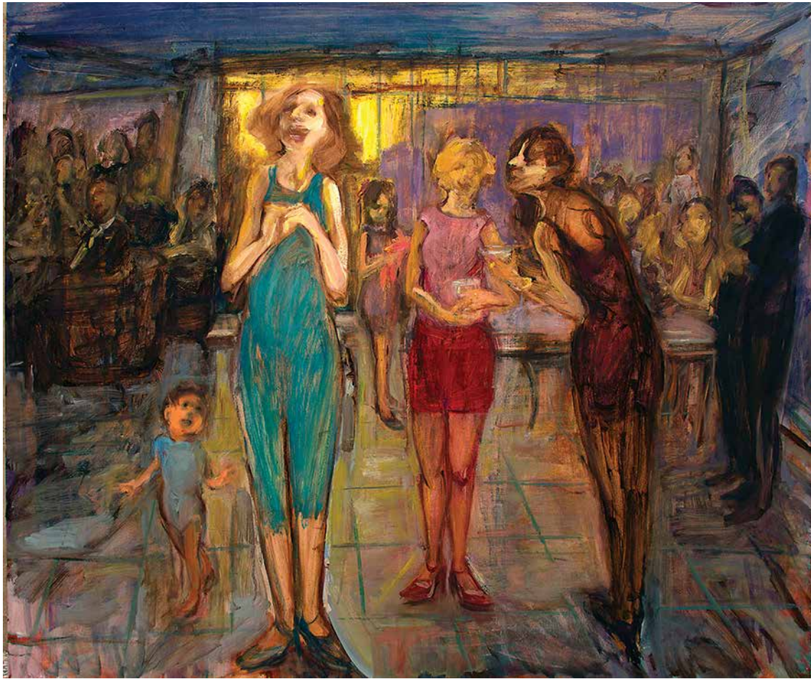
NAVID ZAFAR-ALIZADEH Untitled Oil on canvas 100 x 120 cm 2019