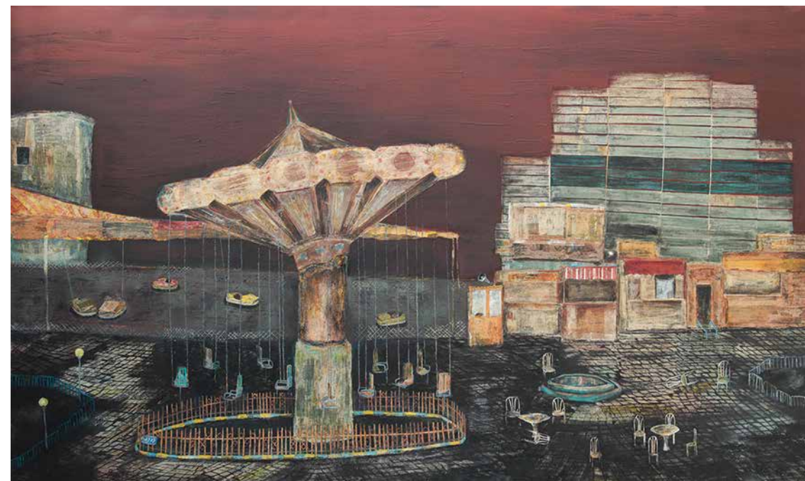
SOLMAZ HESHMATI Untitled Mixed media on canvas 120 x 200 cm 2018