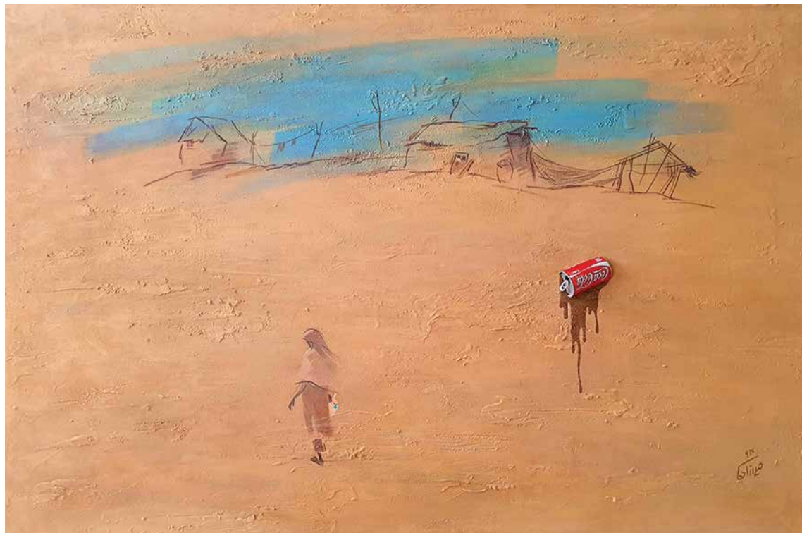
PARVIZ HEYDARZADEH Thirsty Soil Mixed media on canvas 100 x 150 cm 2015