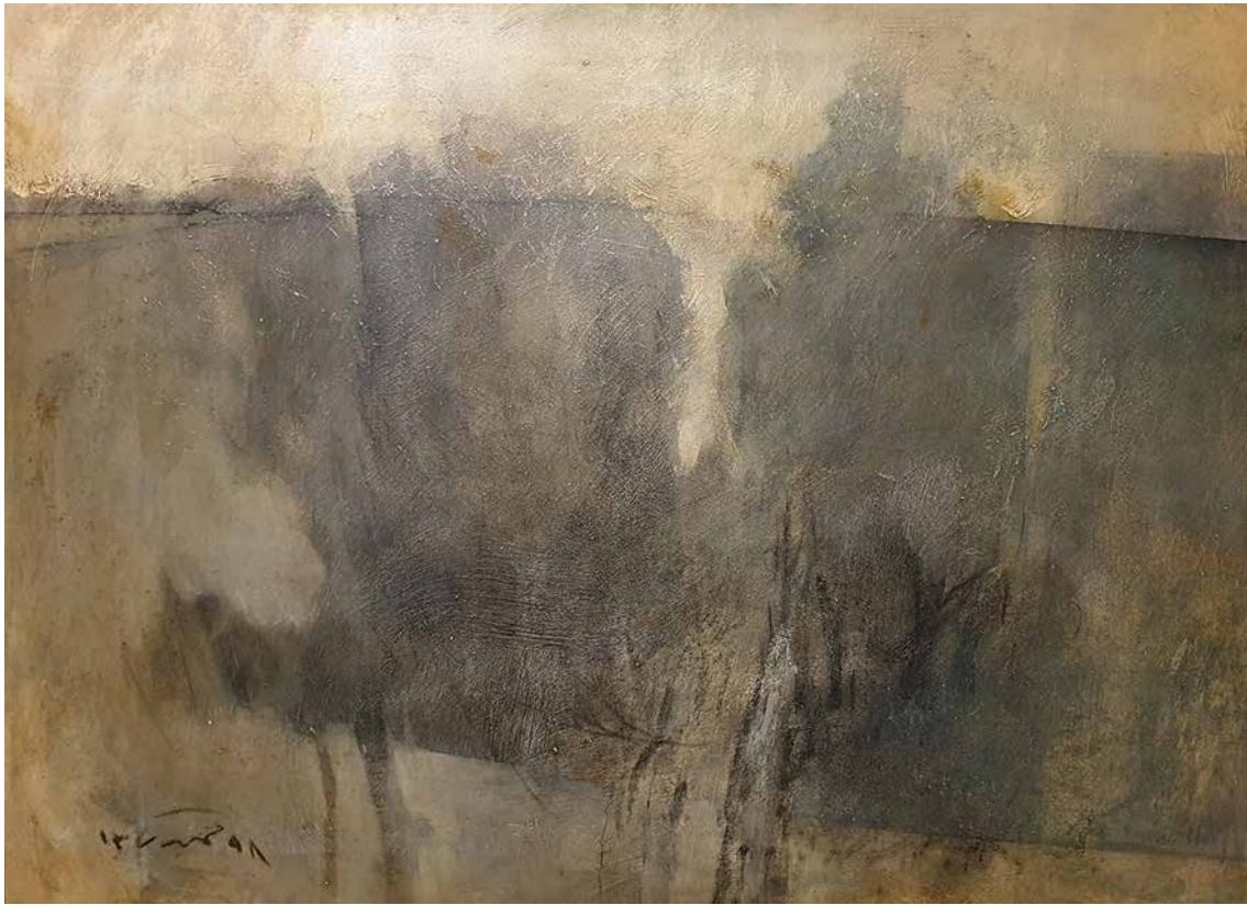
MEHDI TAVAEI-HAMIDI Untitled Oil on canvas 74 x 103 cm 2019