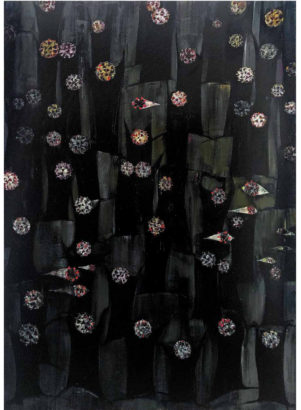
REZA DERAKHSHANI CoroViran #3 Oil on canvas 200 x 140 cm 2020