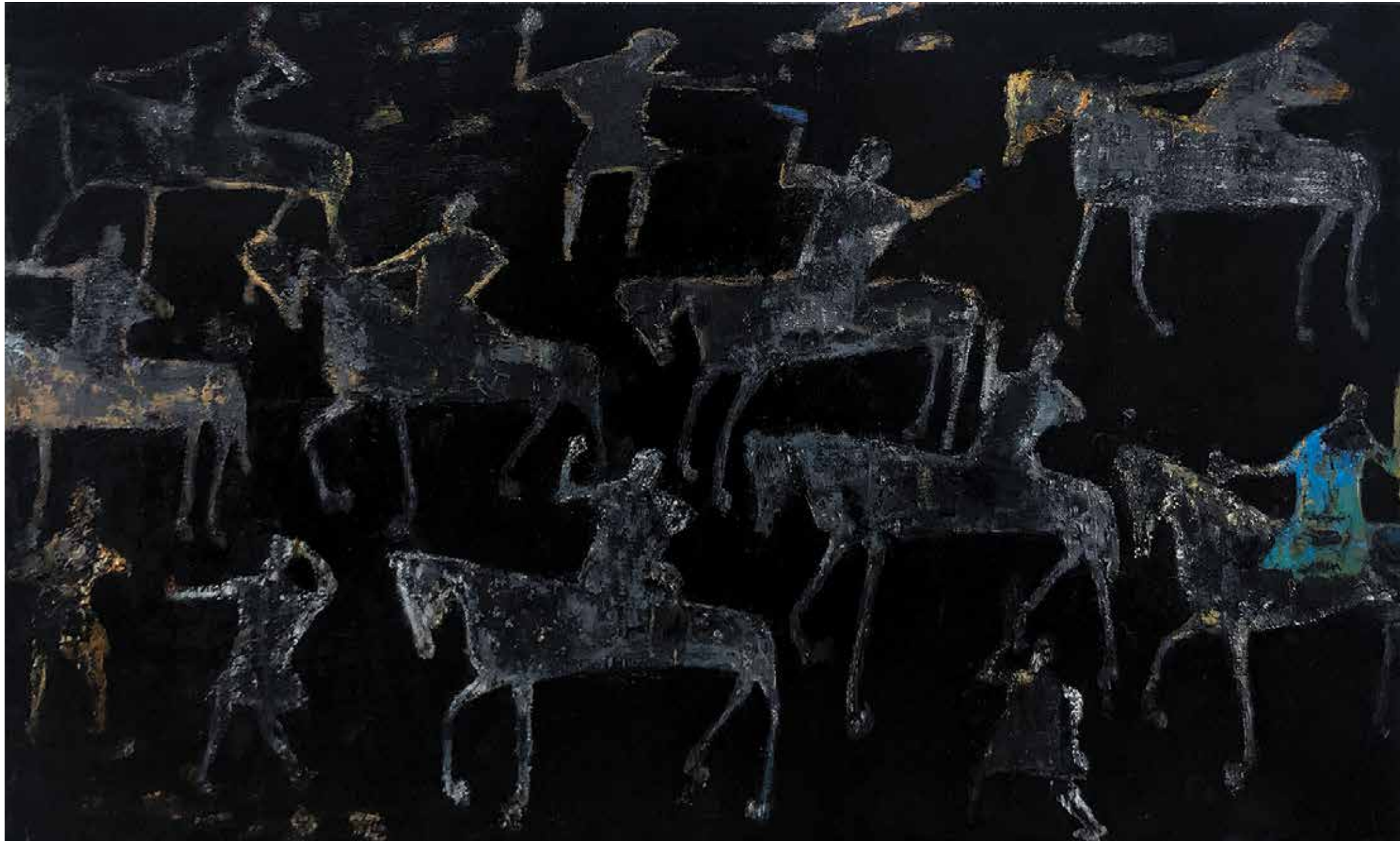
REZA DERAKHSHANI Night Hunt Oil on canvas 120 x 200 cm 2020