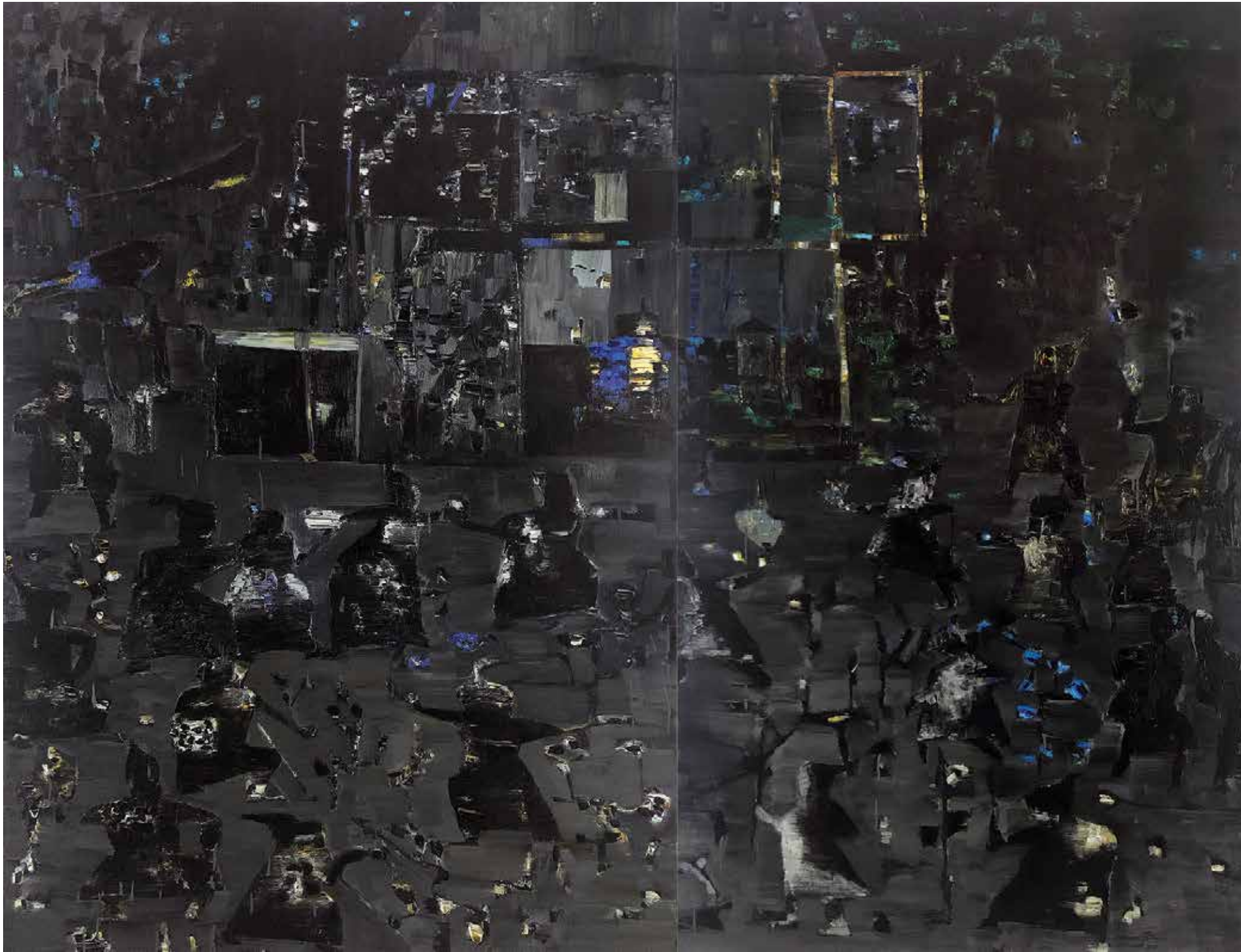
REZA DERAKHSHANI Night Party Oil on canvas 200 x 260 cm 2020