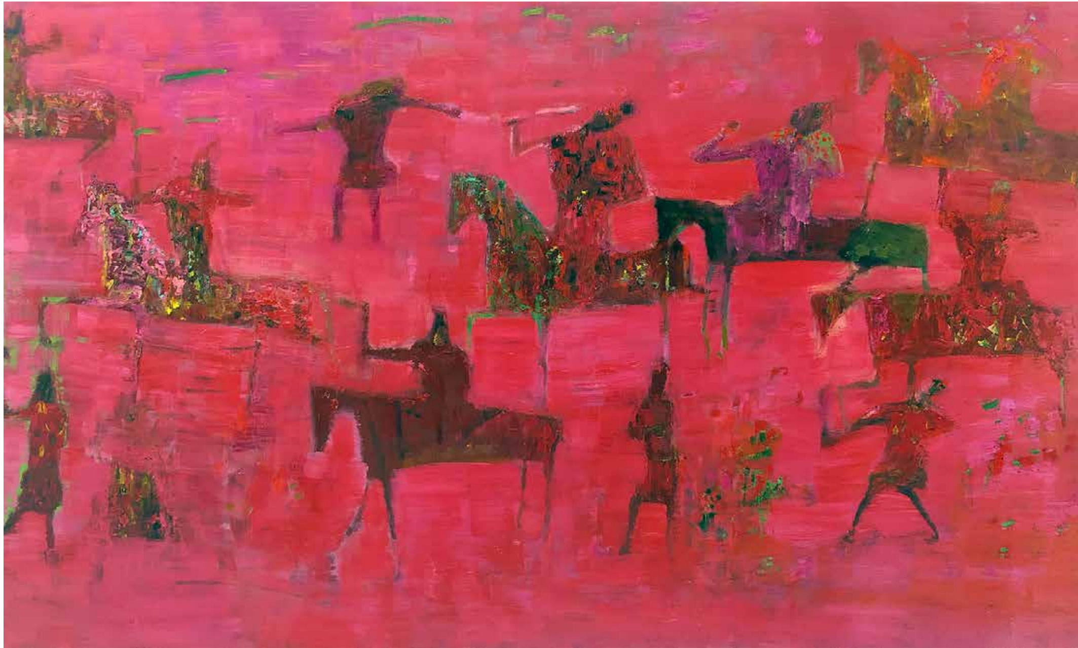
REZA DERAKHSHANI Red Dust Hunt Oil on canvas 120 x 200 cm 2019